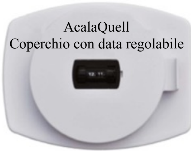
AcalaQuell Coperchio con data regolabile