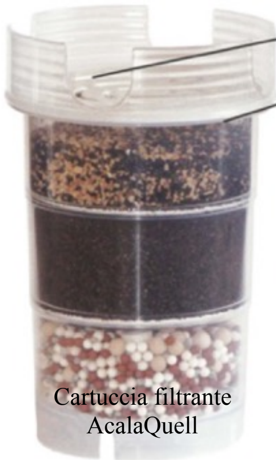
Cartuccia filtrante AcalaQuell